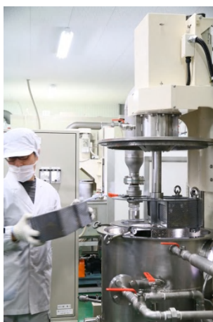
【低床型真空フライヤー】