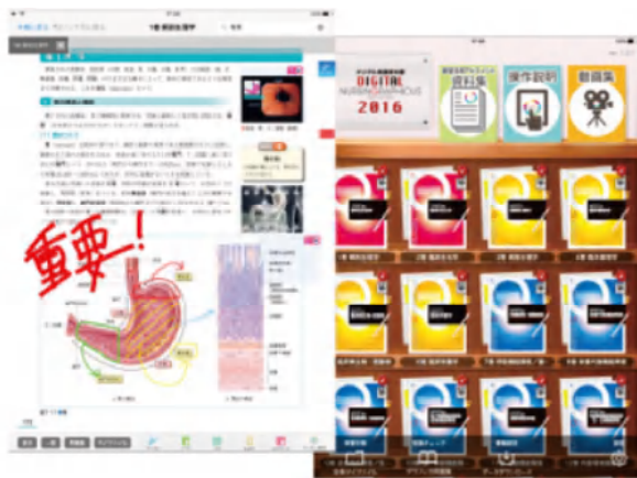
【デジタル看護教科書®】