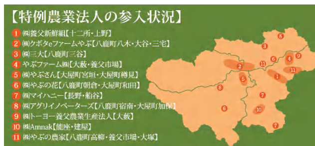
【特例農業法人の参入状況】