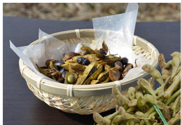
【兵庫の若手農業者と共同開発した「丹波咲々黒大豆」】

お問い合わせ先： 株式会社アトラステクノサービス 統括部長 鯛 氏 TEL 078-965-3119