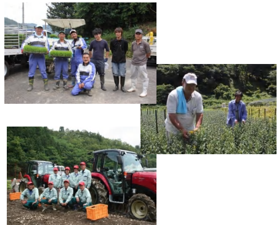
【農地取得をした企業】

お問い合わせ先： 養父市 企画総務部 国家戦略特区・地方創生課 谷 氏 TEL 079-662-3169