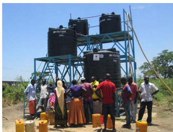
【タンザニアの簡易浄水装置】