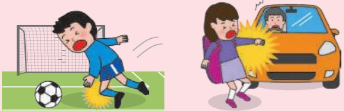
● 団体活動中のケガ ● 団体活動への往復中、車にはねられてケガをした場合

※AW・BW・CW区分にご加入の場合は、上記に加え、「団体での活動中およびその往復中」以外の事故も対象となります。ただし、細菌性・ウイルス性食中毒を除きます。