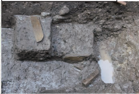
北堀から出土した木製品