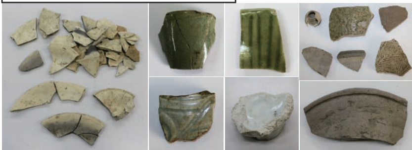
殿屋敷遺跡の出土土器・陶磁器