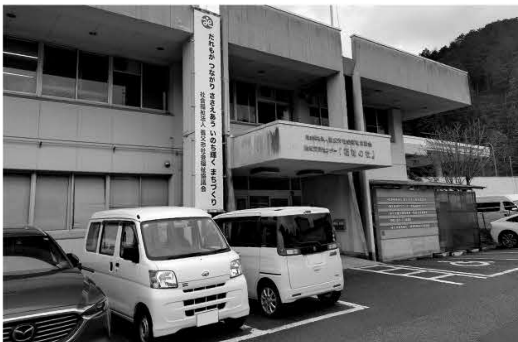
▲ 結婚相談所「ハートやぶ」事務局がある養父市社会福祉協議会本部

答 事業概要の中で、前年度からの変更点は、市内在住を要件に縁結び奨励金を1件あたり5万円から10万円にする。縁結び世話人も、R7年の12人から新年度は18人に増やしたい。結婚相談員は熱意をもって、昼夜を問わずマッチングから成婚まで活動されている。社協では、相談件数34件の内、成婚7組（内2組養父市在住）。