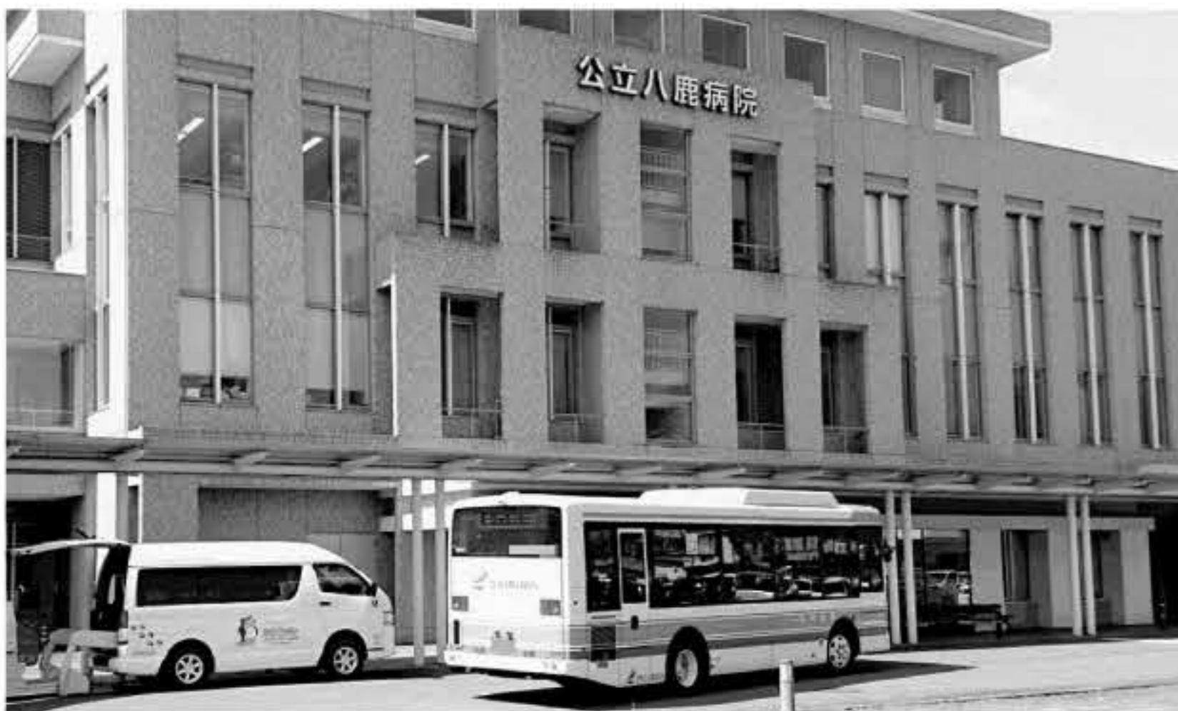
経営再生に臨む八鹿病院

答 あくまでも一時的な支援である。10年度以降は恒常的な経営支援は想定していない。