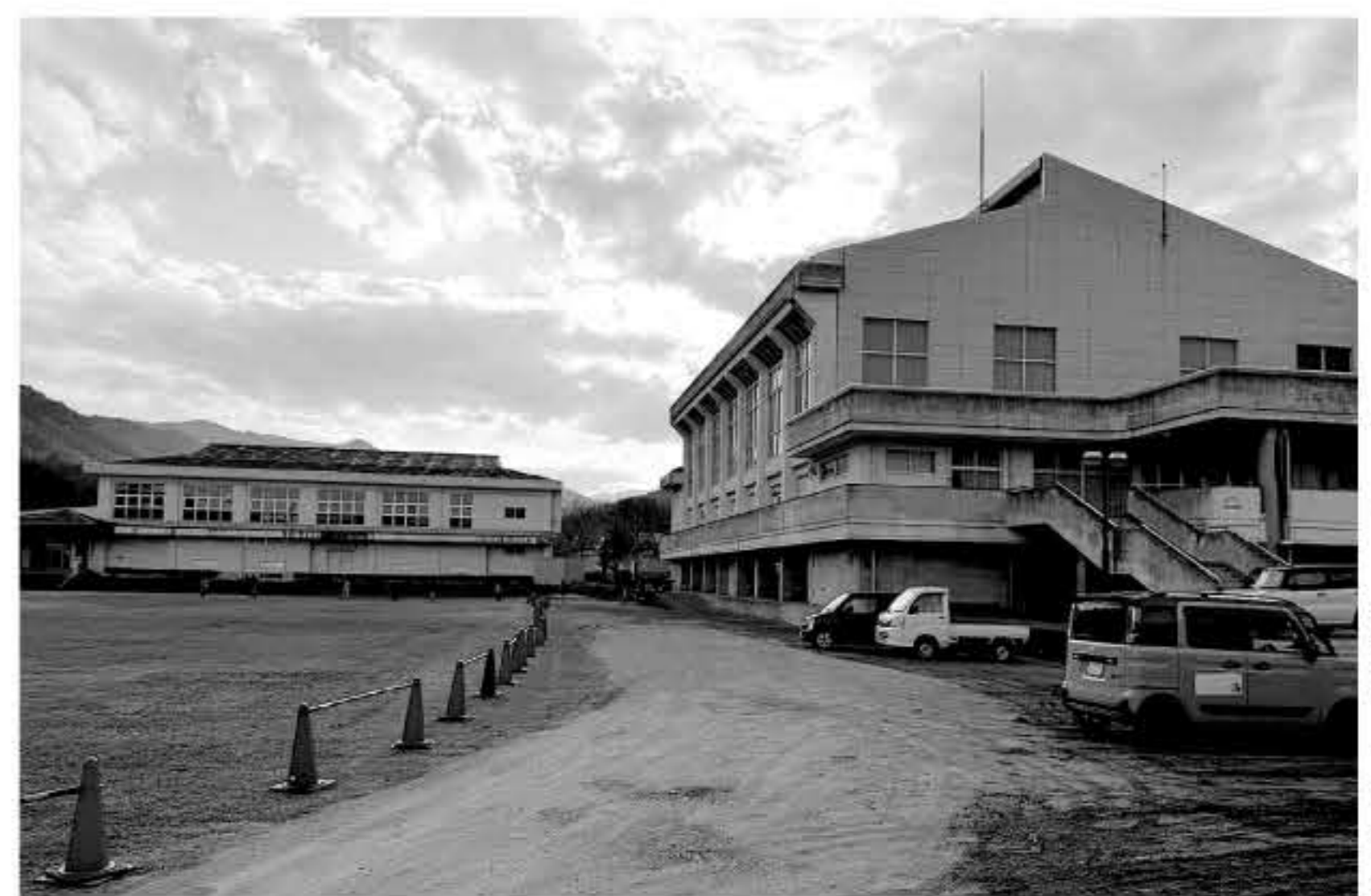
◀ エリア2整備予定地

答 エリア1と一体的な運営を構築したい。令和8年6月までに運営事業者の決定を目指し、具体的な運営方法について検討している。