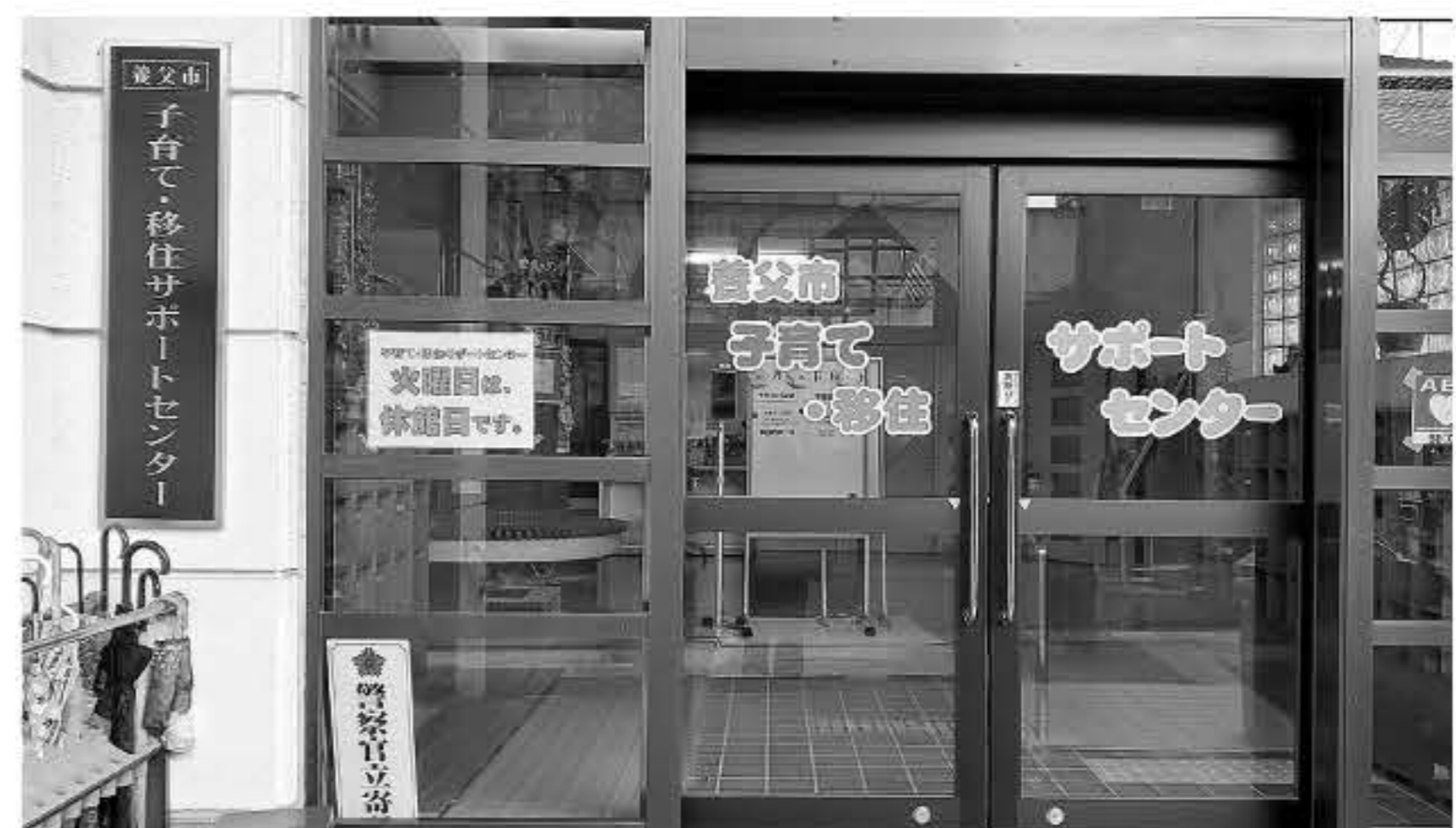
▲ 子育て・移住サポートセンター（天子区）

答 少子化・人口減少は複数要因が絡み合う社会構造上の課題。住宅施策や就労支援など生活基盤に関する政策との連携が重要。人材（人財）育成は重視している。