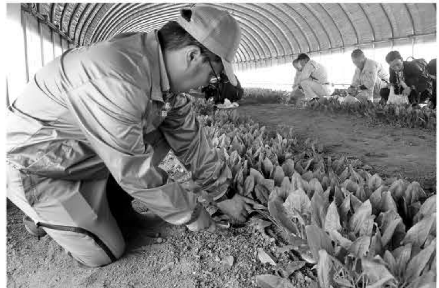
おおよや高原有機野菜初出荷

国の「みどりの食料システム戦略」の後押しを受けながら養父市の有機農業は前進している。市が実施してきた市民を巻き込んだフォーラムの実施、展示会への共同出展、有機 JAS 認証補助などの政策効果が表れている。