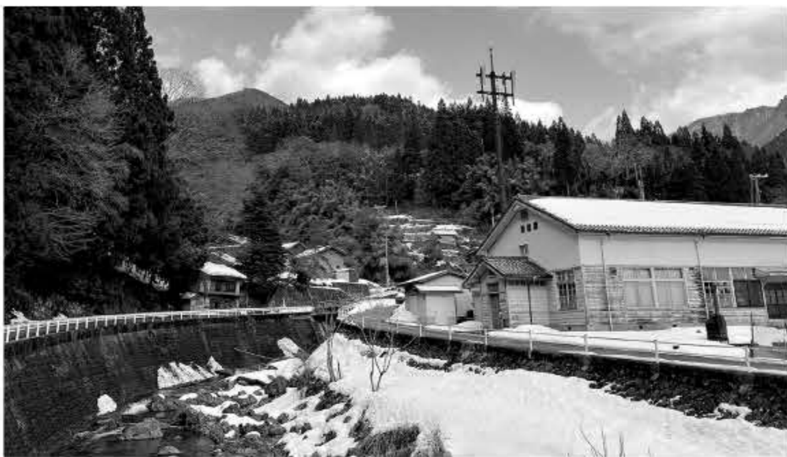
かつての 西谷小学校横行分校

答 山県市の例や異年齢の教育も承知している。参考になる点はあるが、地理的条件や国の制度を考えればハードルが高い。