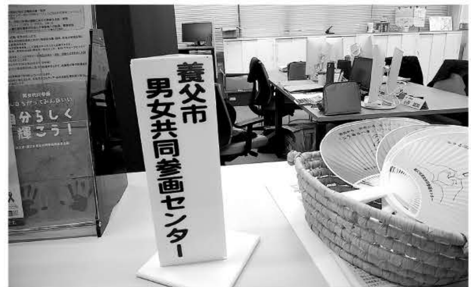
市役所内にある 女性活躍の担当課

答 保育士、看護師などが多く、平均370万円超で200万円以下は週24時間以下の短時間勤務の者。ワーキングプアの状況にはない。