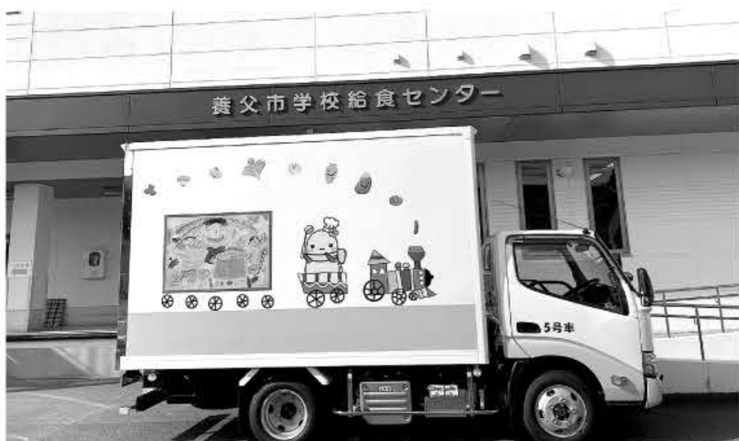
給食センター配送車

◆学校給食センターの調理配送業務の債務負担行為 令和9年度～11年度 3億4,126万円を削除する修正案が提出され、修正可決されました。