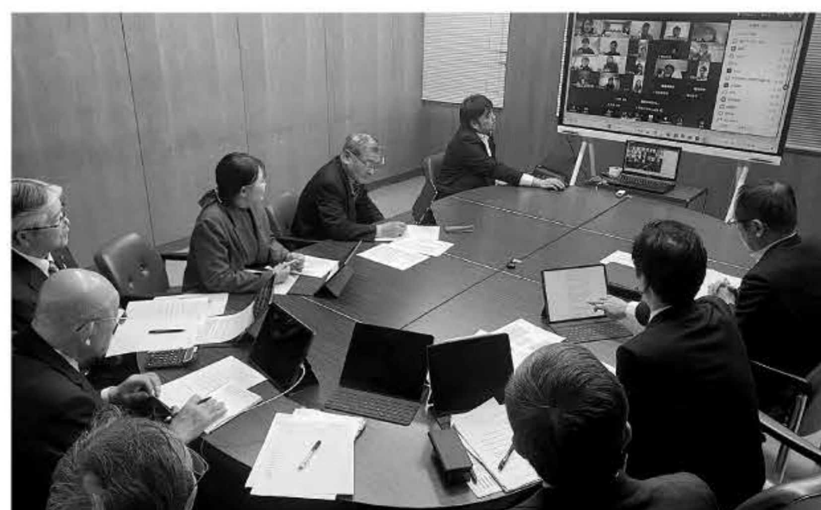
オンライン懇談会

懇談会の主な内容は、後日、議会のホームページなどで公開し、また今後の議会報告会のあり方の検討に反映させていきます。