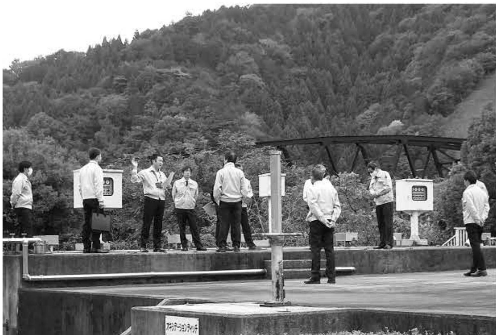
養父中央浄化センターを視察

上下水道事業の課題の一つは技術系職員の不足である。全国的に人材難が顕在化しており、経営・運営の両面で事業を不安定化させている。但馬上下水道事業協議会や兵庫県の指導の下、但馬3市2町で構成する検討部会が組織され、職員の人材育成や相互の協力関係を確立している。しかし自治体間連携が、もうひとつの課題である事業の広域化に直ちに結びつくものではなく、今後の地道な調整や努力が続けられている。