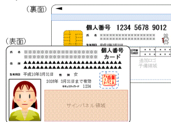
【マイナンバーカード】

※1：通知カードは令和2年5月25日に廃止されていますが、通知カードに記載された氏名、住所などが住民票に記載されている内容と一致している場合に限り、個人番号確認書類として利用できます。