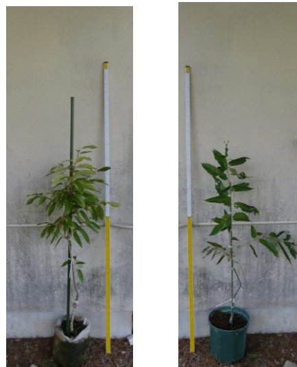
里帰りする後継樹