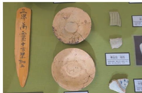
養父市文化財展示室で公開中! 殿屋敷遺跡の木簡と土師器の皿