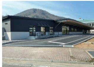
県道から見た外観