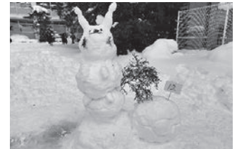
←「八高雪だるまコンテスト」の様子