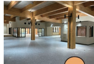
せきのみやリビング