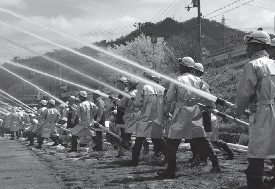
消防団活動に功績のあった団員への各種表彰（敬称略）※所属および階級は受章時のものを記載

4月5日（日）、やぶ市民交流広場で開催しました。功績者を表彰する式典の他、分列進行と一斉放水を行い、団員は消防活動への意識を新たにしました。