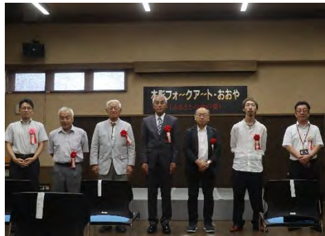
第31回（昨年度）授賞式の様子 （大屋市民センター）