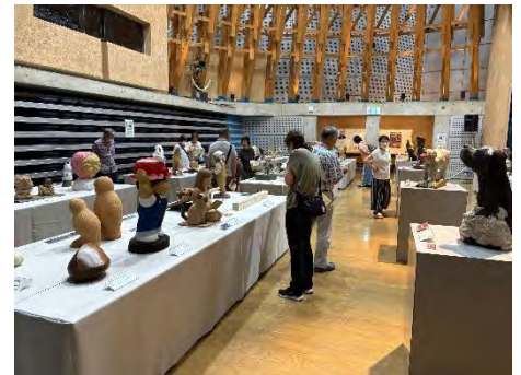
第31回（昨年度）展覧会の様子 （おおやホール）