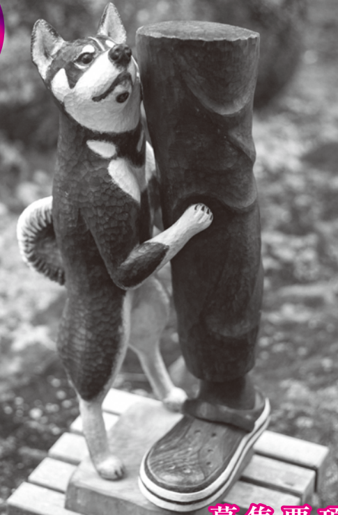
第31回グランプリ 「だあーいすぎ」 水嶋 昌雄 作(樹種クス)