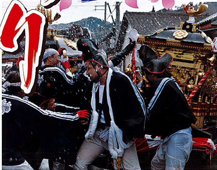
建屋での「練り合わせ」