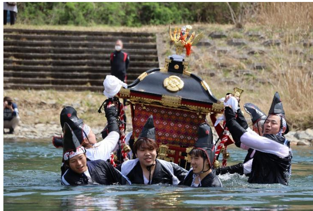
昨年の様子(川渡御)

なお、今年も神輿巡行同行者の規模を縮小するとともに、実施期間も1日間(日帰り)に短縮し開催されます。