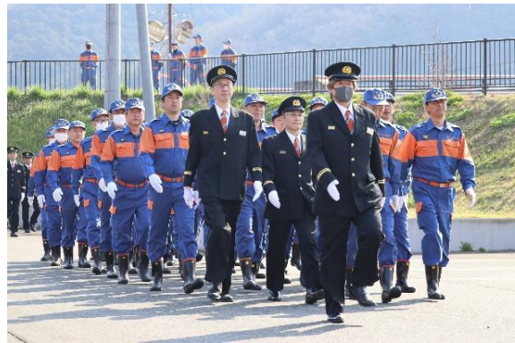
前回の様子（2025年4月撮影）