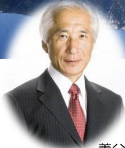
養父市 市長 広瀬 栄