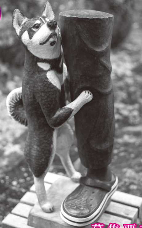
第31回グランプリ 「だあーいすき」 水嶋 昌雄 作(樹種クス)