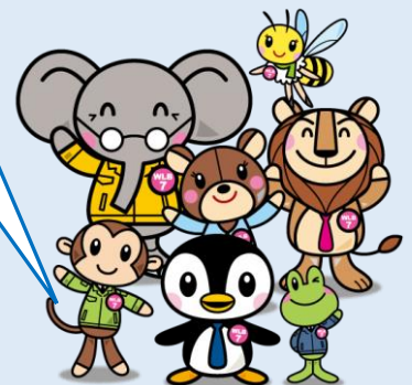
ひょうご仕事と生活センター キャラクター「WLB7」