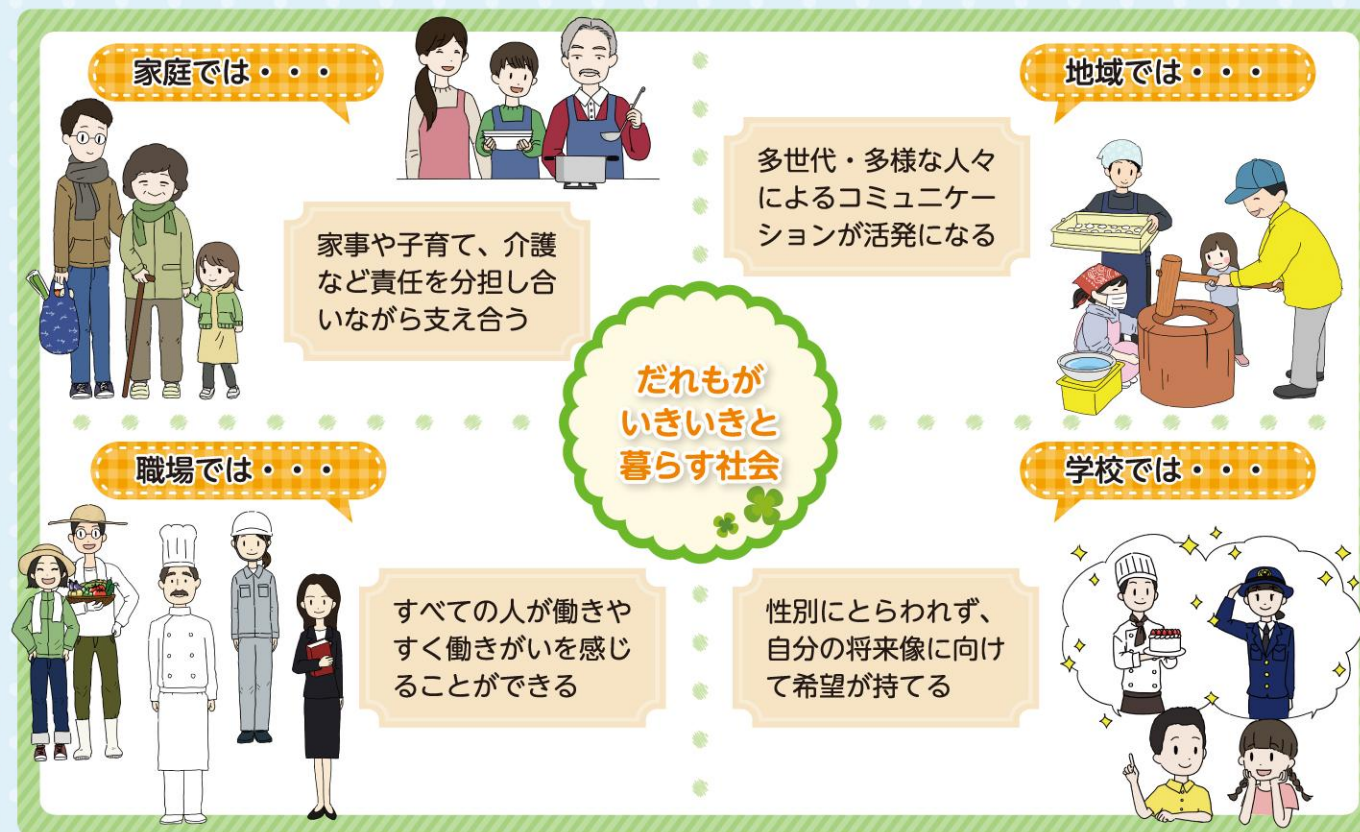
イラスト：高橋安奈