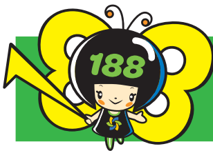
消費者庁 消費者ホットライン188 イメージキャラクターイヤマン