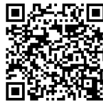
(横断歩道合図 (アイズ) 運動)