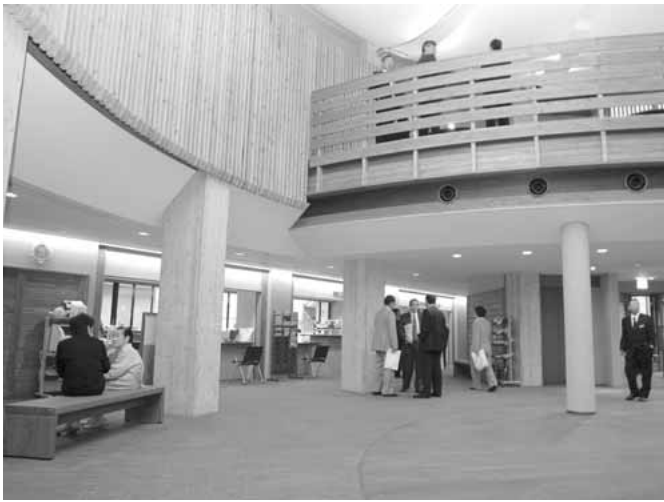
玄関を入ると開放感のあるホールが広がります