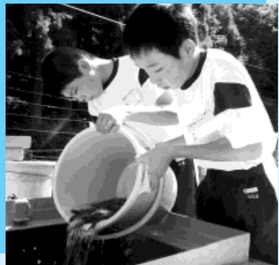
アマゴの出荷準備をお手伝い（氷ノ山養魚場）