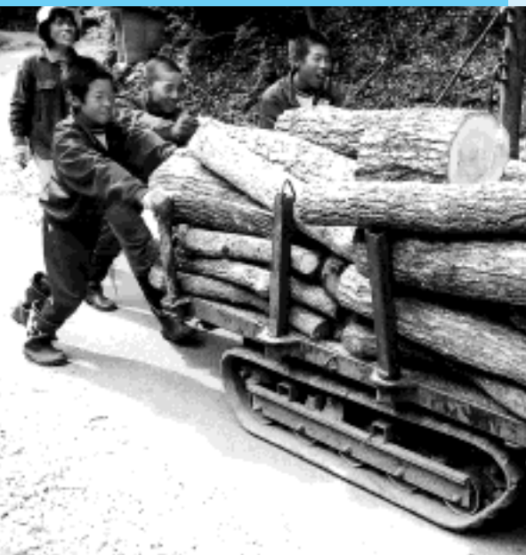
炭焼き用の丸太を機械で運ぶ生徒（ふるや炭工房）