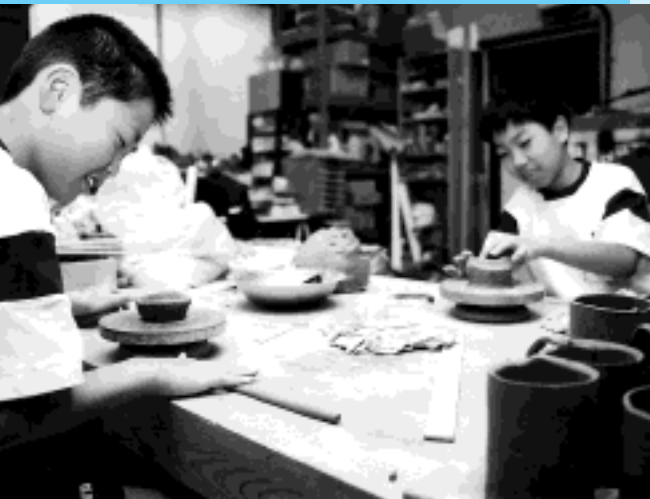
たくさんの陶芸品を作りました（水野陶芸）