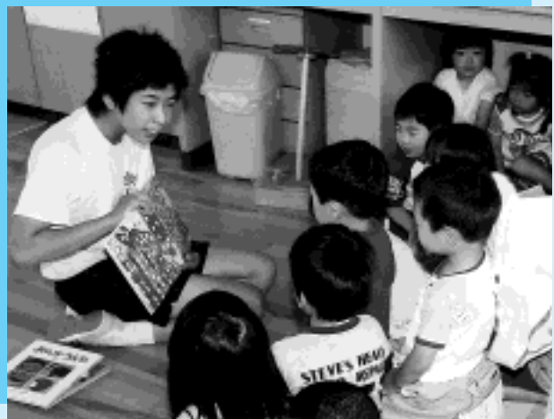
泣かさないようにあやすのって結構大変です（広谷保育所）