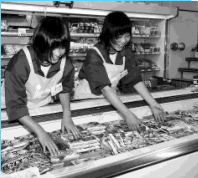
商品の陳列も手際よくなりました（フードなかしまや）