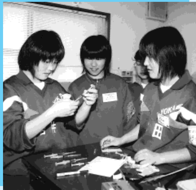
動物の食事を準備します（フジモリ獣医科）