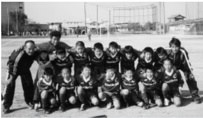
県大会で見事な成績をおさめたフレンドシップ大屋 SC