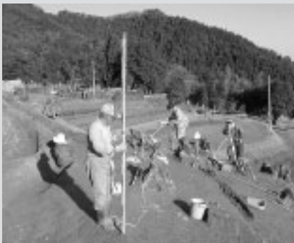
文化財調査の様子