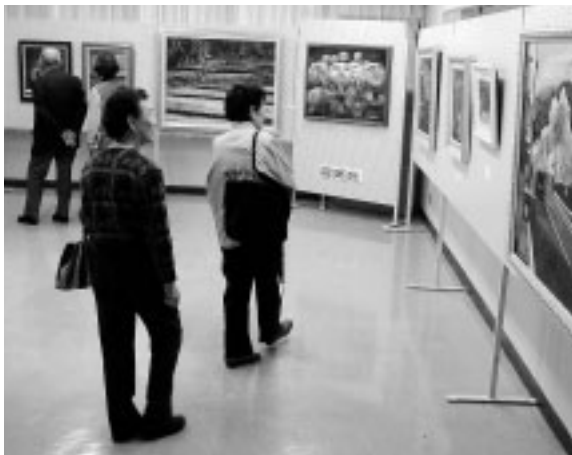
展示された絵画を鑑賞する来場者 (やぶ文化祭)