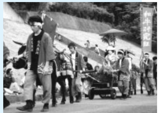
たくましい和牛に引かれて行進する花嫁行列

但農祭で恒例となっている花嫁行列では、農業クラブ和牛研究班の生徒代表が「花嫁行列は但馬農業高等学校の伝統文化として先輩から受け継がれてきました。ごゆっくりご覧ください」とあいさつ。生徒が手塩にかけて育てた和牛が花嫁一行を引き、来場者の間をぬって優雅に行進しました。