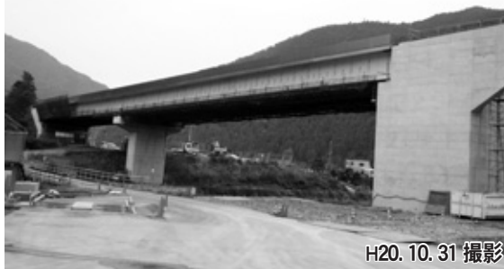
写真1 建屋川の橋りょう工事