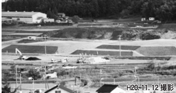
写真2 （仮称）八鹿IC設置工事