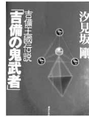
吉備王国伝説 吉備の鬼武者