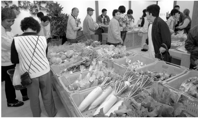
新鮮な野菜が並ぶ農産物直売所