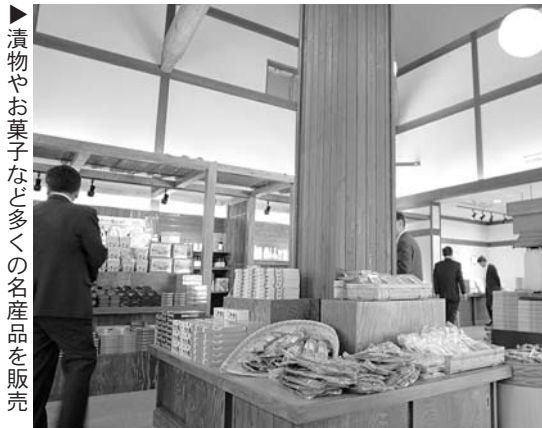
漬物やお菓子など多くの名産品を販売

同施設で販売される農産物は、約90の個人と約10グループが参加する農産物出荷者組織「但馬蔵人の会」が生産したもので、とれたての新鮮な農産物が店頭に並びます。 また、レストランでは、八鹿豚や蛇紋岩米など地元産の食材を多く取り入れた料理が提供されます。