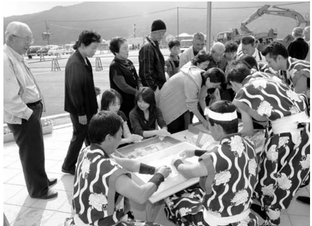
▶ オープンを祝い餅がふるまわれました (11月1日)