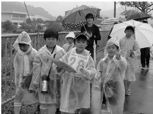
力を合わせてゴールをめざす参加者ら