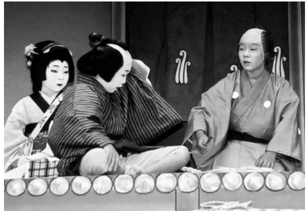
歌舞伎を熱演する子どもたち(野崎村)