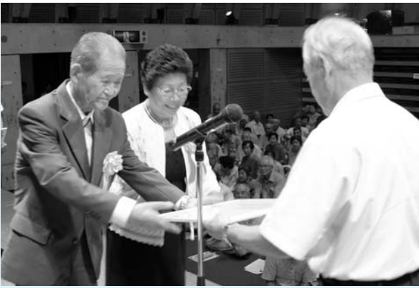
金婚を迎えたご夫婦を祝福