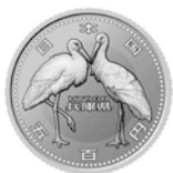
五百円貨幣(表面)「コウノトリ」