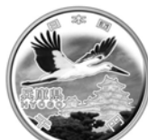
千円銀貨幣(表面)「コウノトリ・姫路城」