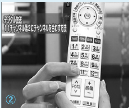
② チャンネルのボタンで、11chを選択する。