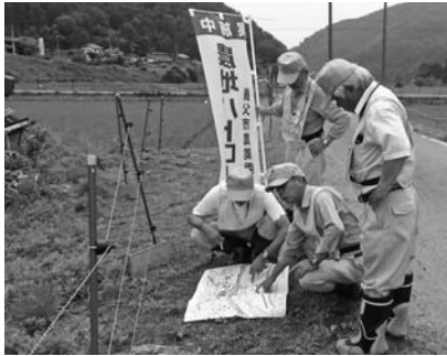
農地パトロールの様子

農地パトロール実施中は、帽子・腕章等を着用し「農地パトロール実施中」の啓発用のぼり旗を立てています。調査にあたっては農地内に立ち入ることもありませんが、皆さまのご理解をお願いするとともに、農地のことで聞きたいことがあれば気軽に声をかけてください。なお、この期間に限らず日常的にパトロールを行っており、問題のある農地をみつけたときは、事務局や県等と連携して早期に指導を行うようにしています。