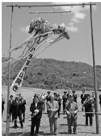
くす玉を割る関係者ら

5月1日、ハチ高原交流促進センター付近で、ハチ高原の夏山開きが開催されました。式典は、安全祈願などの神事、関係者等の挨拶、くす玉わりを行い、登山やトレッキング、合宿、林間学校などの夏山シーズンの到来を祝いました。