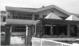
▲建屋小学校の外観