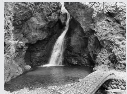
若杉にある不動滝

滝口から出た水は、右から左へと流れて滝つぼに至り、滝つぼからは緩やかに右へと流れを変えています。さらに頭の上を見上げると