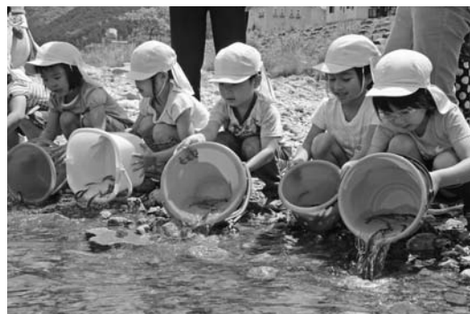
アユを放流する園児ら

5月11日、円山川漁協養父支部が放流する稚鮎250尾の一部を、広谷幼児センターの5歳児24人が放流しました。