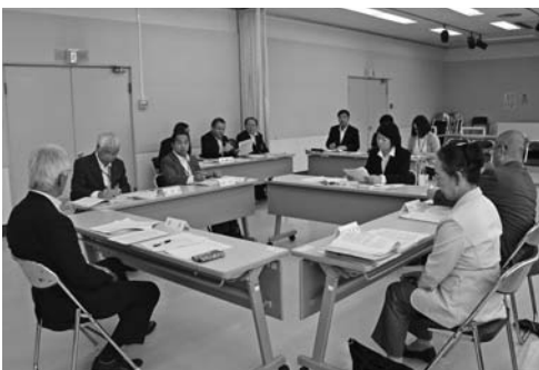
第1回養父市総合教育会議の様子