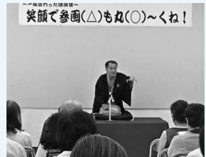
笑顔で参画(△)もね(○)〜くね! 昨年の男女共同参画週間協賛事業セミナーの様子

▼問合せ/人権・協働課(☎662・7601) jinken_kyoudou@city.yabu.lg.jp