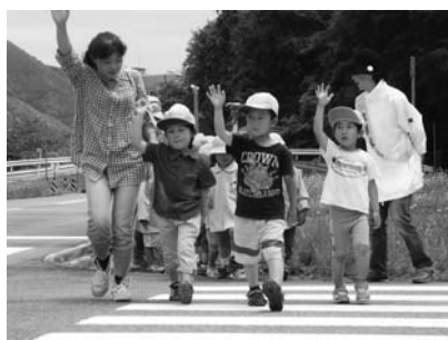
横断歩道の渡り方を学ぶ園児ら

5月18日、但馬運転免許センターで、よいこの交通安全のつどいを行いました。これは、大事な子どもたちを交通事故から守るため、日頃から交通安全指導を行うことが重要であることから、市内の幼保園児を対象に毎年行っているものです。道路の歩き方や横断歩道の渡り方、安全確認を学びました。また、白バイに乗せてもらい、子どもたちはうれしそうでした。