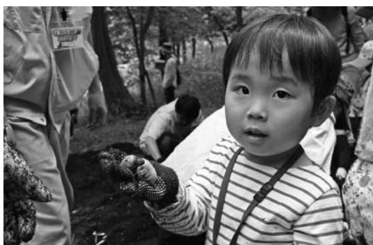
カブトムシの幼虫を見つけた参加者

5月3日、但馬長寿の郷でカブトムシ探検隊パート1が行われ、県内外から子ども連れの家族ら、約1000人が参加しました。