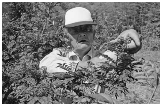
黙々と収穫を続ける福井部会長