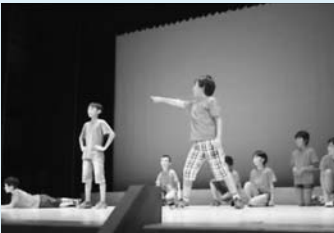
▲創作劇を演じる児童たち