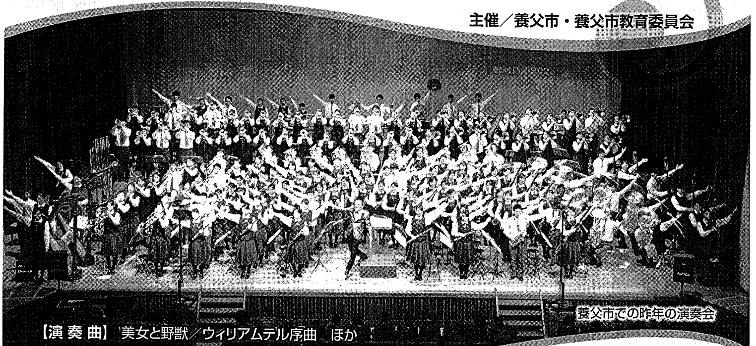
養父市での昨年の演奏会