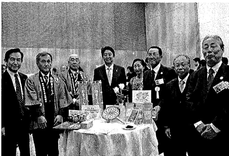
▲交流会で安倍首相と撮影（首相官邸）