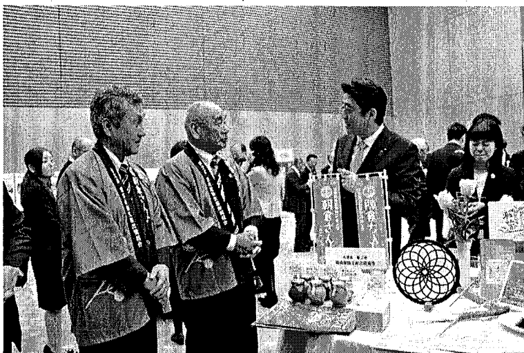
▲安倍首相に取り組みを説明する奥藤区長