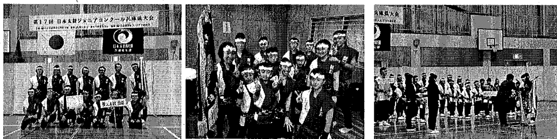
上記、提供可能写真一例