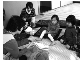
おはなし会の様子