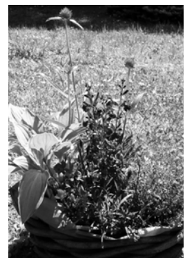
ガーデニングイメージ