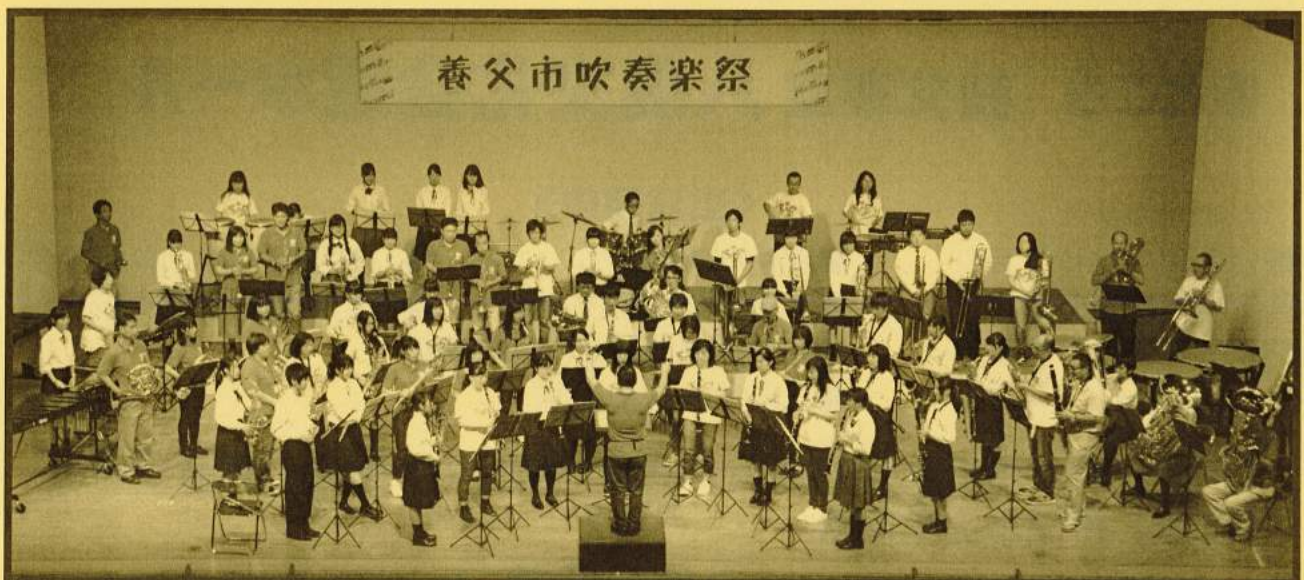
昨年の養父市吹奏楽祭（市内の高校生&社会人による迫力ある合同演奏）