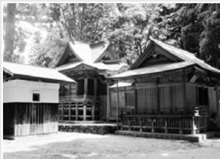
別宮の八幡神社本殿

石清水八幡宮は、貞観元年(858年)に九州の宇佐八幡宮を勧進した神社で、朝廷から伊勢神宮に次ぐ高い崇拝を受けました。全国に広大な荘園をもち、荘園には石清水八幡神の別宮を置きました。また武家の厚い信仰を集めました。